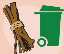
collecte des déchets verts