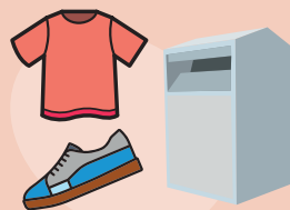
Borne de réception des textiles