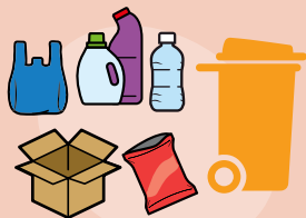
collecte de tri sélectif