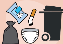
collecte des ordures ménagères